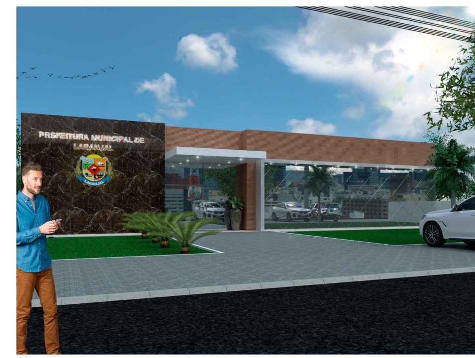
3D FACHADA - IMAGEM 03