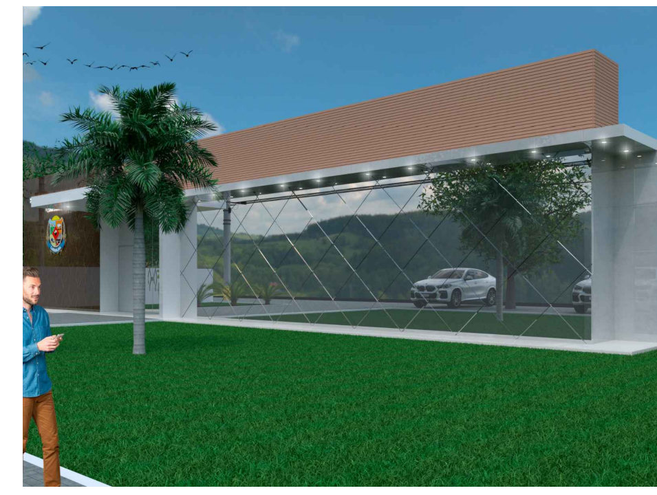
3D FACHADA - IMAGEM 04